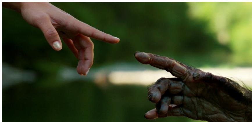
Figuras 5 y 6. El encuentro de Lucy con la especie australopitécida , recreando La creación de Adán de Miguel Ángel (capturas de Lucy , Besson 2014)

memoria de nuestra cultura, se reactualiza mediante el mecanismo creador del texto fílmico que hemos analizado, en una Lucy que vuelve del futuro a la prehistoria, tocando con su dedo la mano de la Lucy Australopithecus . De allí surgirá la humanidad con toda su carga de creación y de destrucción, con sus hallazgos maravillosos y sus increíbles errores y abusos.