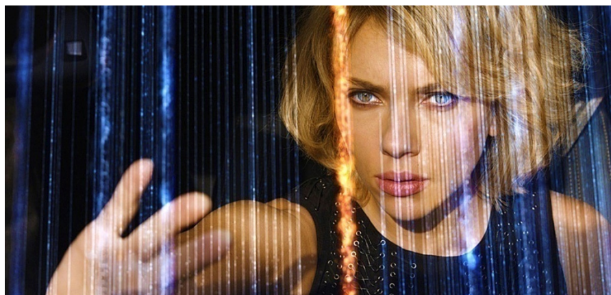
Figura 1. Imagen promocional de Lucy (Luc Besson, 2014)

torno al funcionamiento neurológico. Podríamos afirmar, usando una categoría lotmaniana, que la nueva conformación biológica del personaje es el resultado de una «explosión»: un aumento impredecible en los volúmenes de información que recibe, procesa y organiza. Lo cierto es que, según hipotetizan los científicos actuales, resulta muy probable que la CPH4 sea, efectivamente, el motor de arranque que genera muchas de las características evolutivas del ser humano, sin embargo y sin estar fehacientemente comprobado, el filme lo utiliza como mecanismo central de su ficción. Como explica uno de los personajes, «las mujeres fabrican el CPH4 en la sexta semana del embarazo, en pequeñas cantidades. Para un bebé, tiene la potencia de una bomba atómica. Es lo que le da al feto la energía para formar los huesos del cuerpo» (Besson 2014, la traducción es nuestra). Resulta posible, entonces, repensar a la protagonista a partir de un nuevo juego de configuraciones semánticas, tanto como sujeto biológico como cuerpo intervenido por la ciencia (en este caso, una situación azarosa). En palabras de Donna Haraway, un cyborg . 8