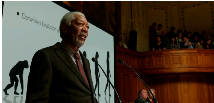
Figura 4. El profesor Norman (Morgan Freeman), disertando sobre las capacidades cognitivas del cerebro; de fondo, el modelo gráfico de la evolución darwiniana (captura de Lucy , Besson 2014)

miligramos. Aún nos es posible determinar ninguna señal de inteligencia. Actúa más como un reflejo. Una neurona, estás vivo. Dos neuronas, te mueves, y con el movimiento empiezan a ocurrir cosas interesantes. La vida animal en la Tierra se originó hace millones de años. Pero la mayoría de las especies solo usan del 3 al 5% de su capacidad cerebral. No es sino hasta que llegamos a los seres humanos, hasta arriba de la cadena alimenticia, que finalmente vemos una especie que utiliza más de su capacidad cerebral. 10% puede no parecer mucho, pero es mucho si consideramos todo lo que hemos hecho. Ahora, vayamos a discutir un caso especial: el único ser viviente que usa su cerebro mejor que nosotros, el delfín. Se estima que este increíble animal utiliza hasta el 20% de su capacidad cerebral. En particular, esto le permite tener un sistema de ecolocación más eficiente que cualquier sonar inventado por el hombre. Pero el delfín no inventó el sonar: lo desarrolló naturalmente. Y esta es la parte crucial de nuestra reflexión filosófica de hoy: ¿podemos concluir que a los seres humanos les interesa más tener que ser? (...) (Besson 2014, la traducción es nuestra).